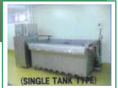
(SINGLE TANK TYPE)